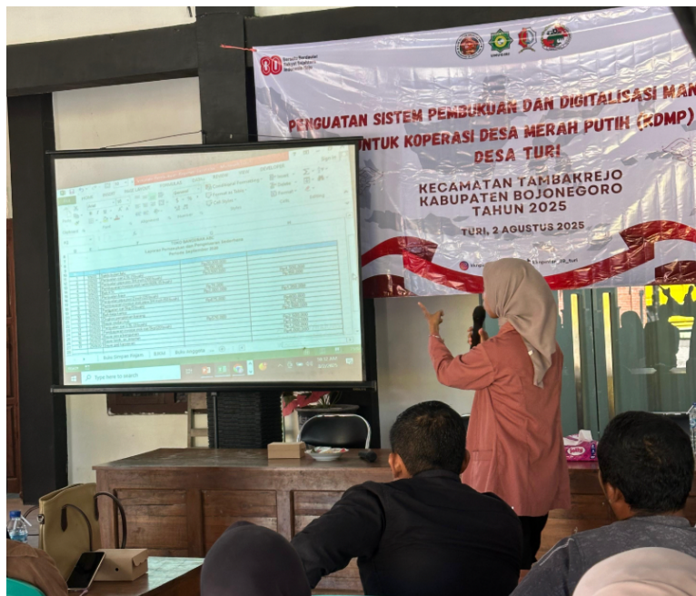
Gambar 3. Penjelasan penggunaan template Microsoft Excel dalam workshop KDMP

Hasil utama yang diperoleh dari kegiatan ini adalah: