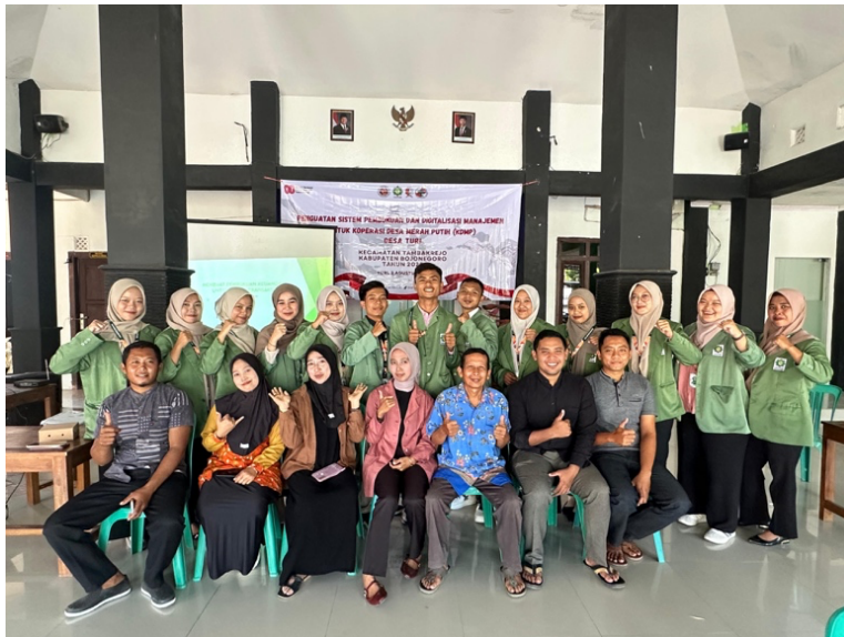
Gambar 2. Dokumentasi kegiatan workshop penguatan kepengurusan KDMP